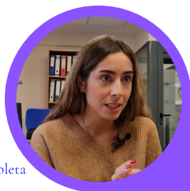
Entrevista completa en YouTube

Trabajadora social ofreciendo talleres de formación, prevención y sensibilización en el Programa de Mujer de Cáritas Diocesana.