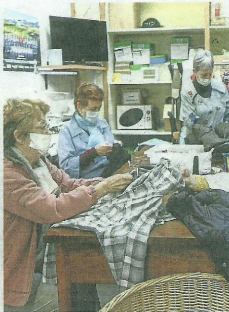
Voluntarias de Cáritas recuperan ropa para Kooperera. R. G.