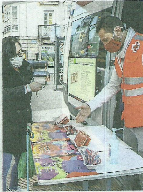
Acción de Cruz Roja en el día contra el Sida. JESÚS ANDRADE