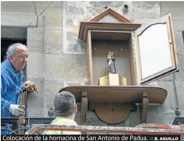
Colocación de la hornacina de San Antonio de Padua.

quiénes se encontraban tras este inusual delito. Ayer, las pesquisas dieron sus frutos. La corona había sido sustraída presuntamente por un hombre que después la vendió a un establecimiento de artículos de segunda mano de la capital del País Vasco. Ayer, efectivos policiales se presentaron en la tienda y recuperaron la corona, que pertenece a la estatua de la Virgen Dolorosa es del siglo XIX y que tiene «gran valor histórico». El presunto ladrón será imputado por un delito de hurto, según informó en una nota el Departamento de Seguridad. El expediente de este caso ya ha sido trasladado al juzgado de guardia, Instrucción número 3, para que abra la vía penal.