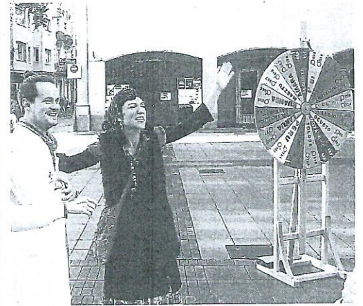
PITONISA EN LA PLAZA DEL ARCA. Se sabe la fecha en la uno llega a este mundo, pero no cuándo se va, aunque esto último cambió ayer con la pitonisa del Arca, que adivinó la esperanza de vida de la población. Se trataba de una iniciativa de medicusmundi Araba, que contó con profesionales de la salud, para concienciar sobre la ruleta de nacer en países menos desarrollados.