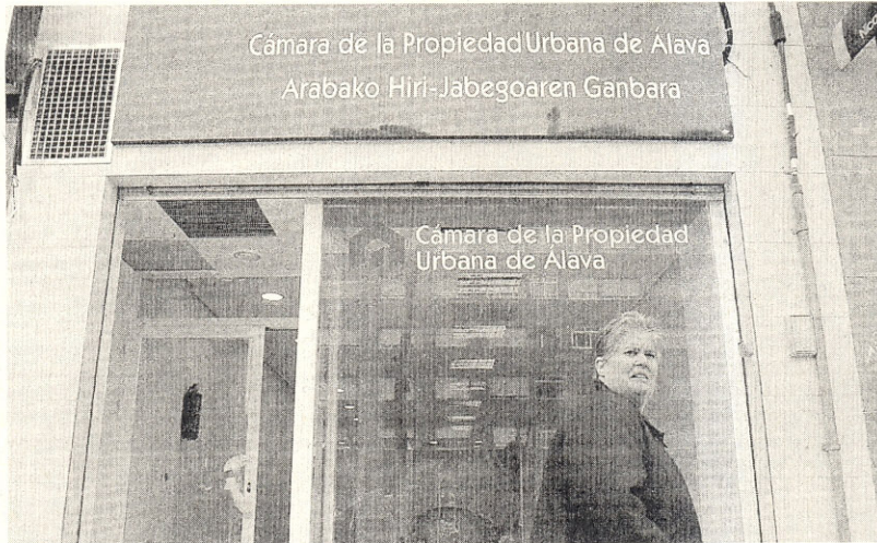
SEDE de la asociación Cámara de la Propiedad, que ahora se llama Propietarios de Álava.

Esta versión, sin embargo, es negada por los abogados de la nueva Cámara de la Propiedad Urbana. Los letrados aseguran que la denuncia del particular —formulada en junio de 2006— fue archivada porque la investigación emprendida resultó negativa. «Y así se recoge el acta favorable que la Agencia de Protección de Datos emitió en diciembre de ese mis-