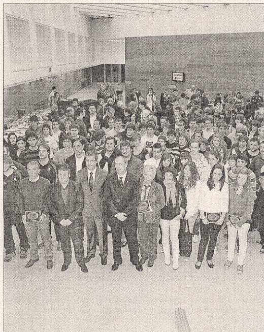
Los deportistas premiados y las autoridades posan en el Kursaal.

La parlamentaria socialista invocó la Ley de Defensa de la Competencia, cuyo artículo 11 "instaura un sistema de seguimiento de las ayudas públicas" y permite a las autoridades de la competencia emitir informes sobre los mismos.