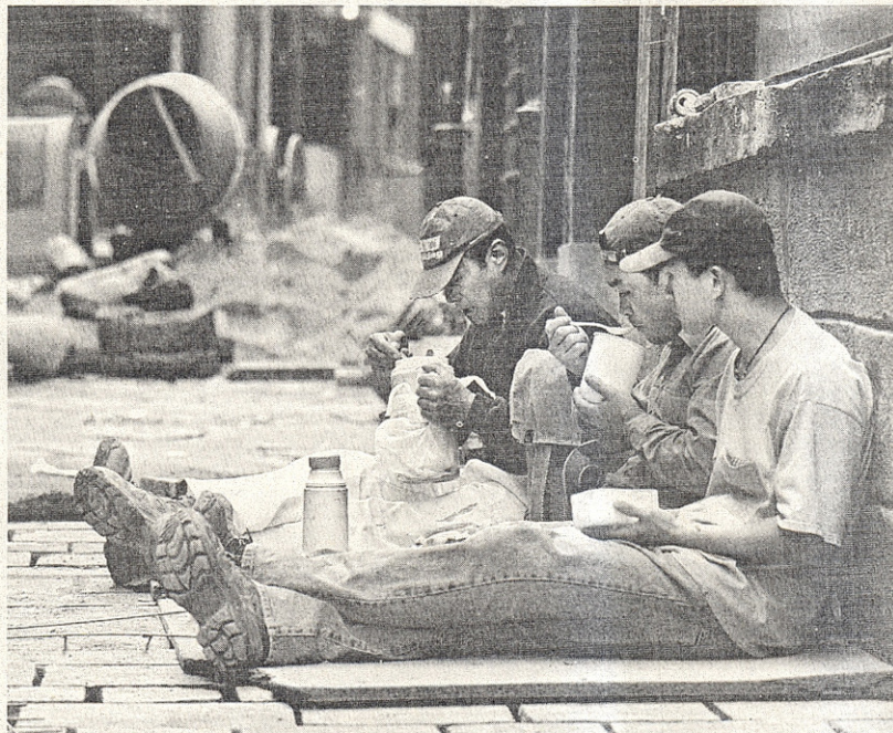
PREOCUPACIÓN. La ONG ha abierto 2.000 expedientes más que el pasado año.