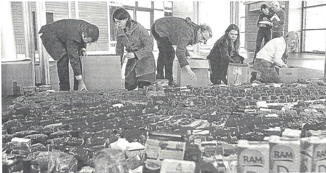
Una parte de los alimentos recogidos por los trabajadores del Parque Tecnológico de Miñano.