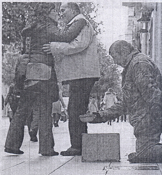
Un hombre pide en una calle de Vitoria.