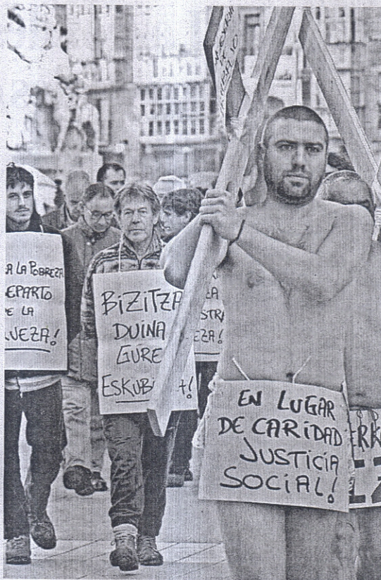
Manifestación en Gasteiz contra la exclusión social.