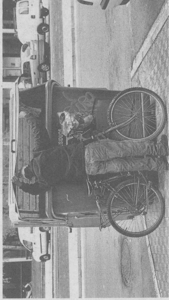
Un hombre mira un contenedor de reciclaje en una calle de Vitoria.

Ante este panorama, el número de atenciones de Cáritas a estas personas en 2013 ha aumentado respecto al pasado ejercicio. Los datos que baraja la delegación vitoriana hasta el 30 de noviembre hablan de 14.664 encuentros con estas personas en los despachos de acogida -la puerta de entrada para acceder a alguna de las ayudas de este colectivo-, 183 más que en 2012. Las ayu-