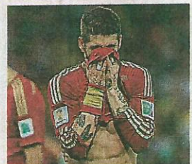
Sergio Ramos lur jota, atzo.