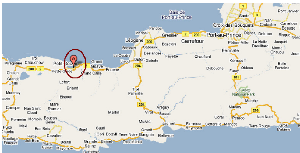
Mapa 1. Situación de la réplica

Por el momento no se han confirmado consecuencias significativas de este nuevo terremoto, que, según las primeras informaciones, no ha ocasionado víctimas.