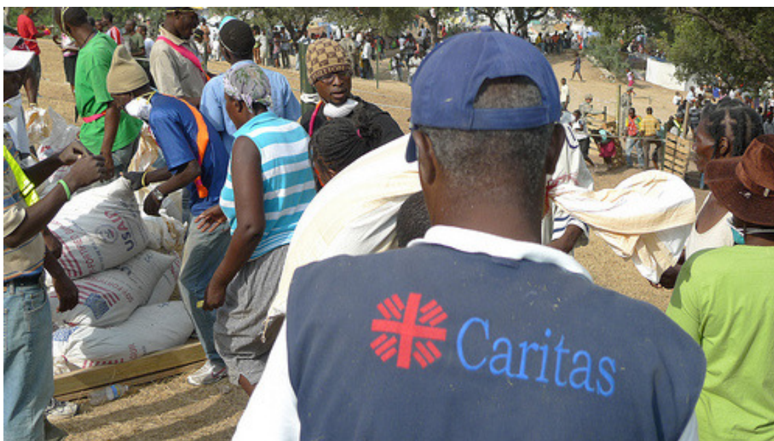
Reparto de ayuda humanitaria.

Asimismo, Cáritas Dominicana está ejerciendo un impagable papel como anfitriones de todos los miembros de la red internacional de Cáritas que se han desplazado a Haití a lo largo de este primer mes.