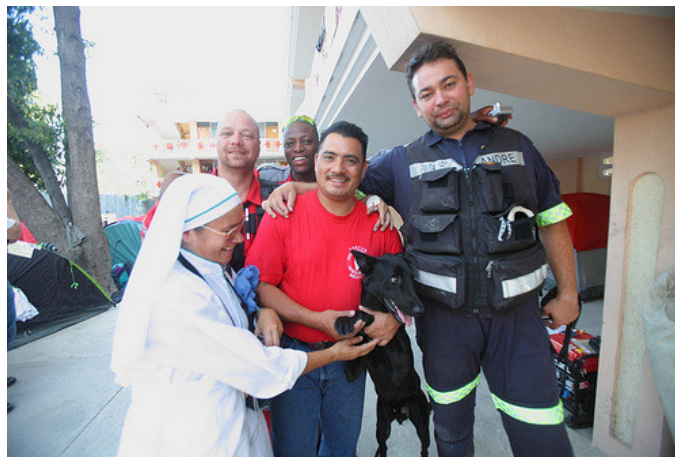
Uno de los equipos de rescate de Cáritas en la sede de Cáritas en Puerto Príncipe.

Caritas ha establecido equipos de trabajo en los distintos sectores de intervención de la emergencia, en los que participan tanto el personal local de Cáritas Haití como los expertos enviados por Cáritas Internationalis. Cada equipo está involucrado en los clusters (comités de coordinación) respectivos de las Naciones Unidas sobre ayuda alimentaria, logística, agua y saneamiento, salud y vivienda.