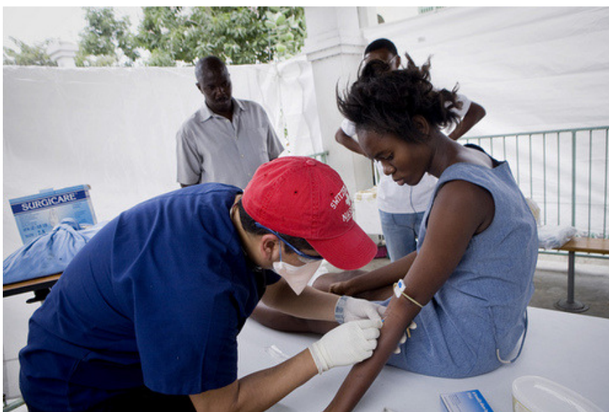
Un médico de Cáritas atiende a una de las víctimas del terremoto.

Asimismo, el Programa Mundial de Alimentos ha asignado a la red Cáritas tres zonas de distribución de alimentos en Puerto Príncipe: una que incluye las áreas del Champ de Mars y el palacio presidencial, otra que abarca el Golf Club de Petionville y una tercera, en la zona de Cazeau. En cada uno de estos sectores, Cáritas lleva a cabo operaciones de reparto de sacos de 25 Kg de arroz a las familias damnificadas.