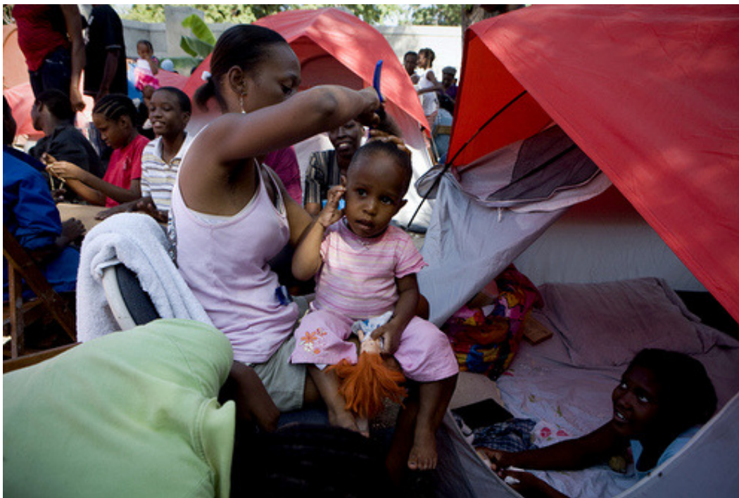
Una familia alojada en una de las tiendas de campaña distribuidas por Cáritas..

Caritas ha sido capaz de movilizar una gran cantidad de alimentos, kits de higiene, agua y materiales de emergencia para construir refugios de forma rápida y apoyar la rehabilitación de un hospital y 6 dispensarios.