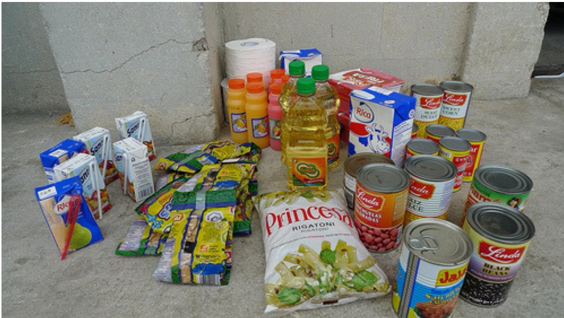
Uno de los lotes de alimentos que Cáritas distribuye en Haití.

Todos los miembros de Cáritas están siendo asignados para asumir las diversas funciones definidas en el llamamiento de ayuda ( Emergency Appeal , EA detallado en el punto siguiente) emitido el 20 de enero, con su correspondiente programa de respuesta. En este sentido, la red Caritas ha empezado ya a planificar la fase de recuperación y rehabilitación.