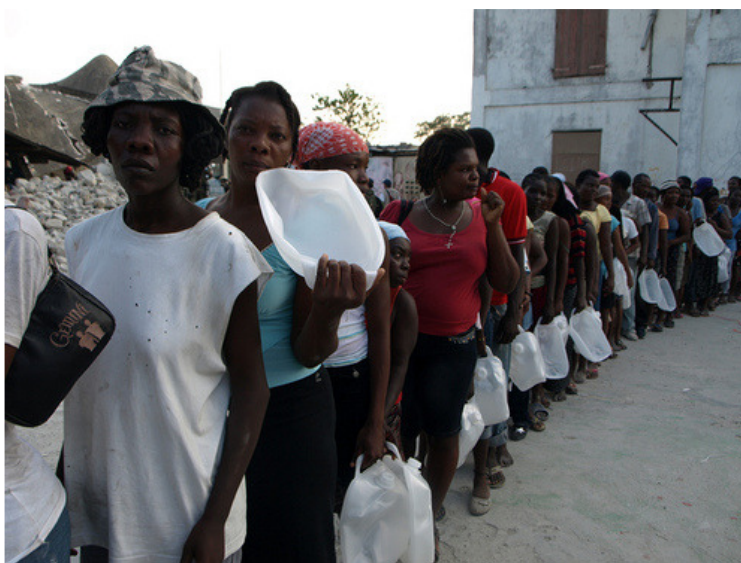
Un grupo de damnificados esperan el reparto de ayuda en un punto de distribución de Cáritas.

Por su parte, el puerto de Puerto Príncipe está en condiciones para recibir, de forma restringida, cargamentos de ayuda después de las reparaciones realizadas para restablecer el tráfico de buques. Asimismo, las carreteras principales están transitables.