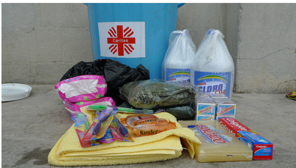
Lote de productos higiénicos que Cáritas está distribuyendo a los damnificados.

En esta ocasión, tanto la sede de los poderes ejecutivo y legislativo como los ministerios se derrumbaron e hizo necesario ubicar de forma provisional al Gobierno a una comisaría cercana al aeropuerto.