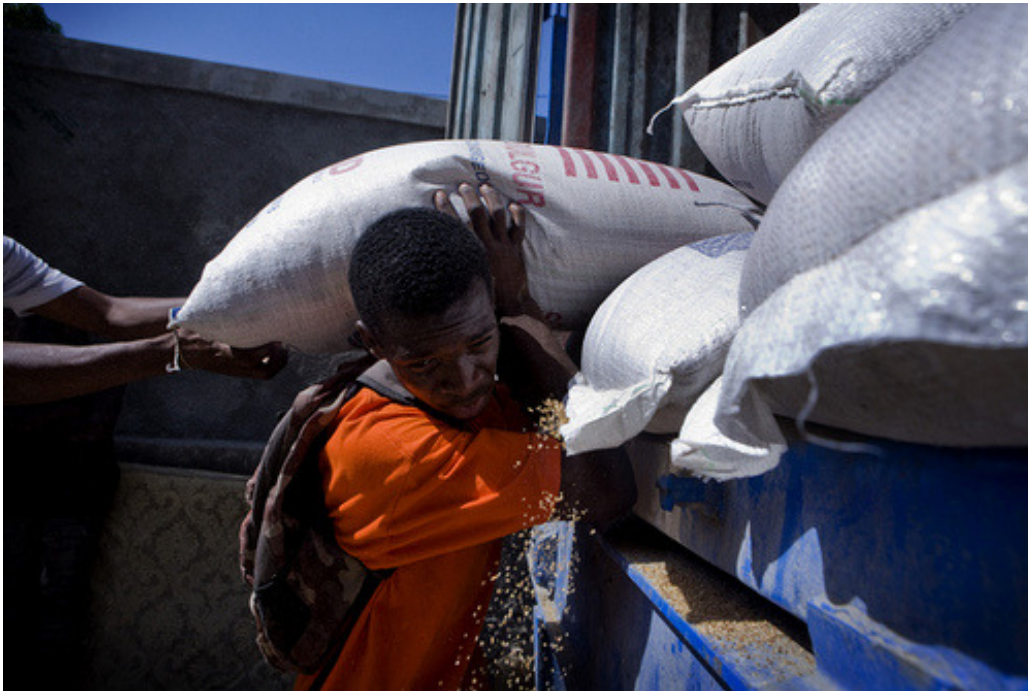
Distribución de ayuda alimentaria en Puerto Príncipe